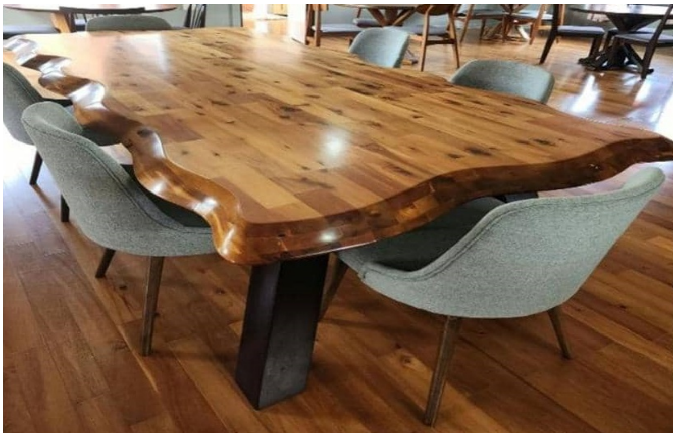
Meja makan kayu Acacia.

Pembangunan hutan yang ditanam mesti dipertingkatkan untuk hasilkan hasil yang tinggi dan kayu yang berkualiti